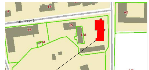
SITUACIJOS SCHEMA Mindaugo g. 17, Trakai